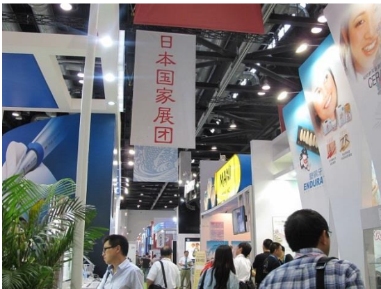
日本ブース上部には垂れ幕