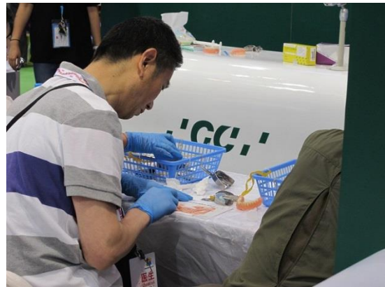
(株)ジーシーブース：実演コーナーは人ばかり