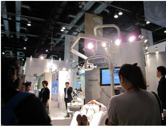
会場入口入ってすぐの(株)モリタブース： 診察台に寝ているのはまるで人間のような実習用ロボット