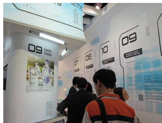
ドイツのイベントブース「科学実験館」内部