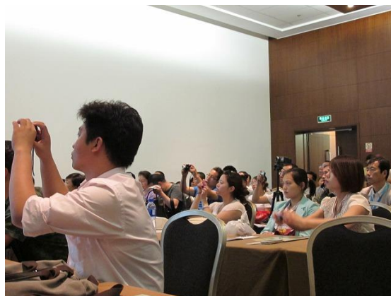
重要なスライドには一斉に携帯電話が向けられる