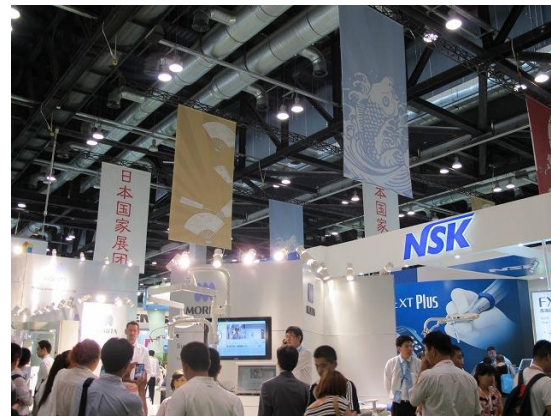
垂れ幕はかなり上で視界に入りにくい