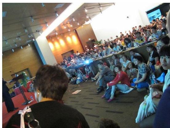
会場に入りきれない来場者がドア付近にあふれる